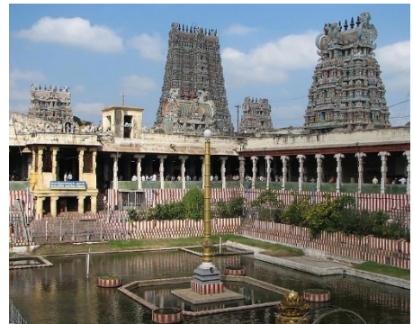
Şakta'ların Menekşe (Balık Gözü) Tapınağı