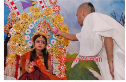
A new goddess is being made.